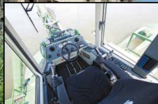
Cabina moderna y confortable